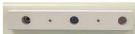
Plus Minus Plus